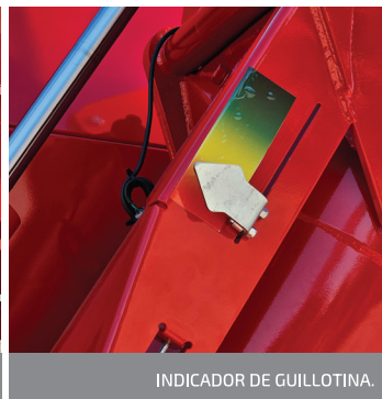
INDICADOR DE GUILLOTINA.