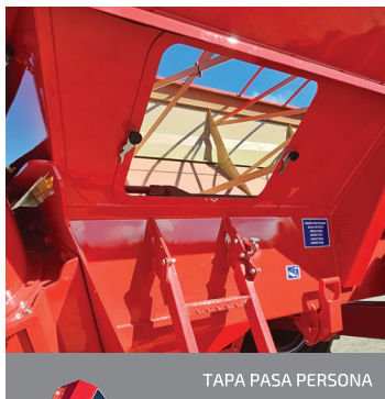
TAPA PASA PERSONA