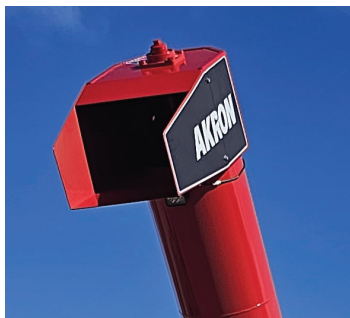
ÓPTIMA POSICIÓN DEL TUBO DE DESCARGA