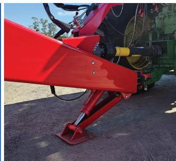
PIE HIDRÁULICO INTEGRADO.