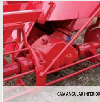
CAJA ANGULAR INFERIOR.