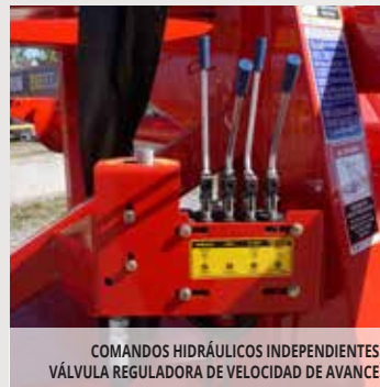
COMANDOS HIDRÁULICOS INDEPENDIENTES. VÁLVULA REGULADORA DE VELOCIDAD DE AVANCE.