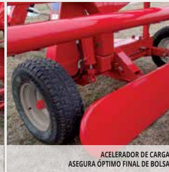
ACELERADOR DE CARGA. ASEGURA ÓPTIMO FINAL DE BOLSA.