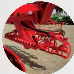
KIT PARA ARROZ