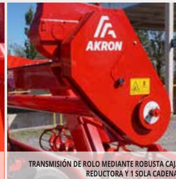
TRANSMISIÓN DE ROLO MEDIANTE ROBUSTA CAJA REDUCTORA Y 1 SOLA CADENA.