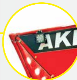
Luces de trabajo.