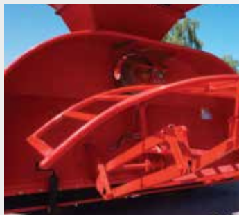
EASY LIFT PERMITE MEJOR COLOCACIÓN DE BOLSA.