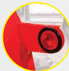
Luces de transporte.