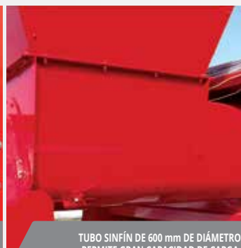
TUBO SINFIN DE 600 mm DE DIÁMETRO PERMITE GRAN CAPACIDAD DE CARGA.