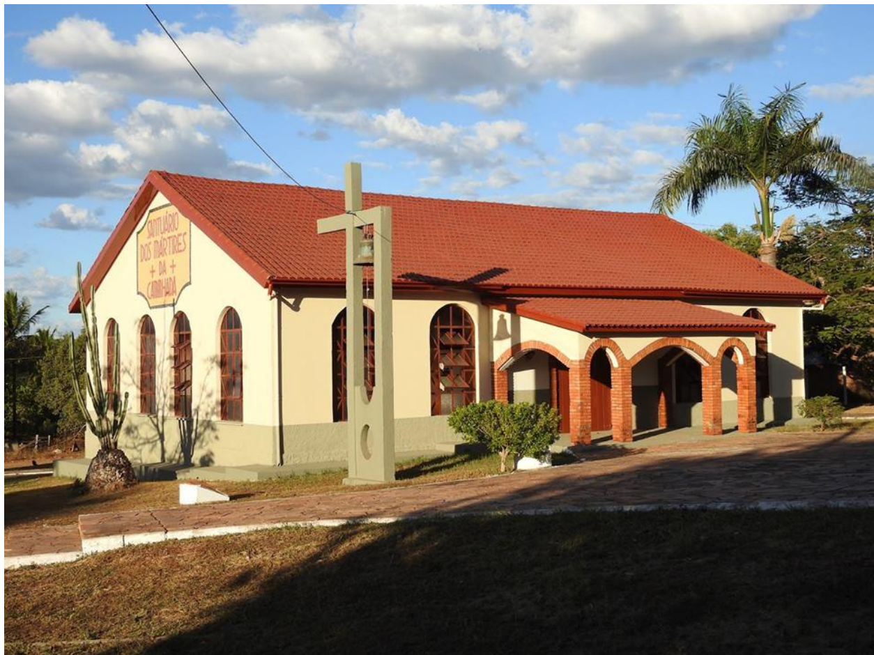
Santuário dos Mártires da Caminhada em Ribeirão Cascalheira