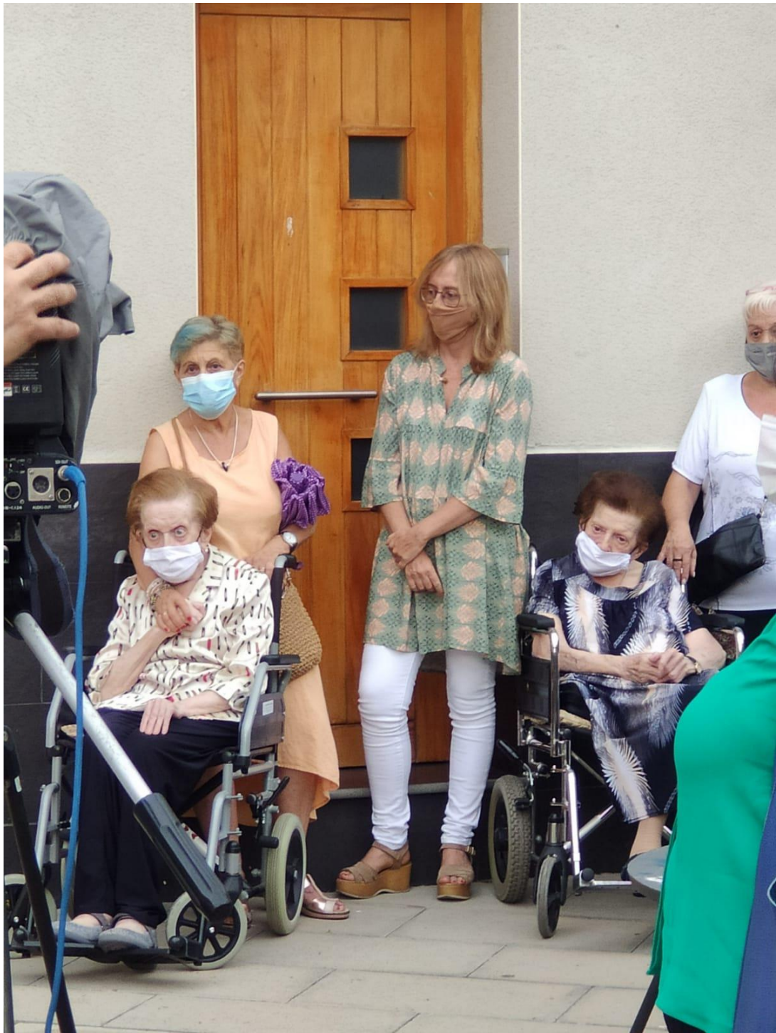
Suas irmãs (em cadeiras de roda) com parentes, defronte à casa da família Casaldàliga, em Balsareny na Catalunha – Espanha