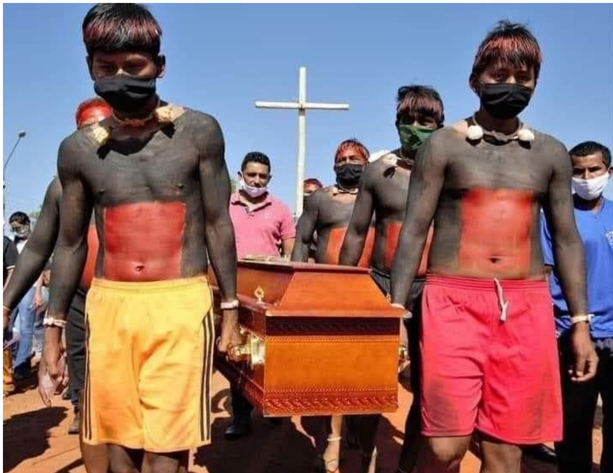
Indígenas Xavante carregando o corpo de Dom Pedro Casaldáliga

Na terra sagrada do cemitério dos Karajá, sua última morada