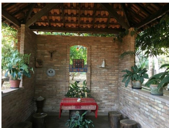
Capela na casa de Dom Pedro Casaldáliga, com paredes abertas para as árvores e os pássaros

Mas Pedro prosseguia sempre, em qualquer circunstância, no seu diálogo interior. Isso, mesmo quando sacoleja horas a fio nos ônibus precários pelas estradas de terra da Prelazia, ou mal acomodado nos barcos, subindo e descendo o Araguaia, para visitar comunidades ribeirinhas ou aldeias indígenas.