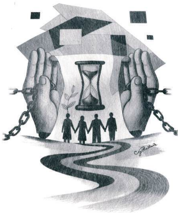
Sergio Ricciuti Conte