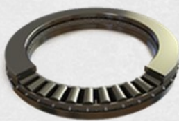
Rolamento axial de rolos cônicos inferior