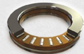
Rolamento axial de rolos cilíndricos superior