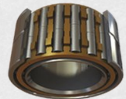
Rolamento radial superior