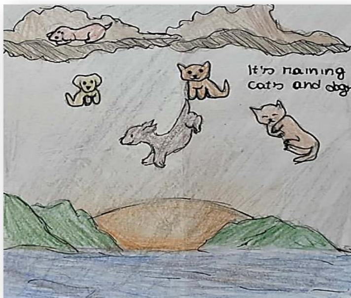
(Picture 01 – Illustration done by students in a language classroom).

33. From what is briefly explained in text 03 , the image below (Picture 01) represents: