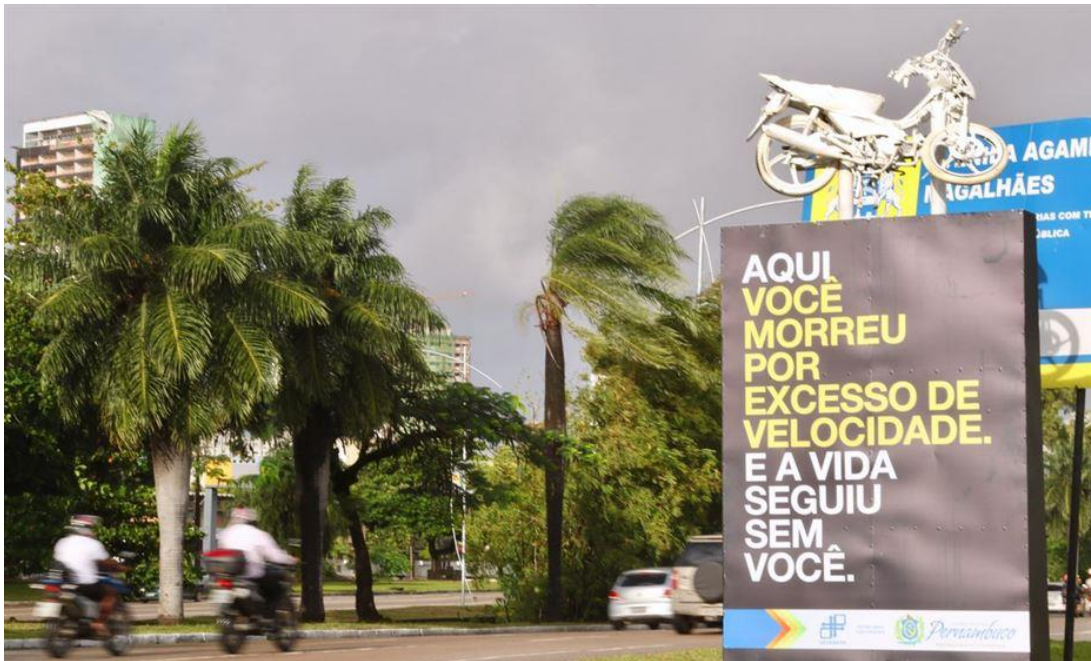
A minha vida sem mim – Campanha do Detran e do CTTU, lançada no Dia do Motociclista.