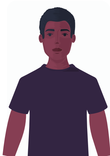
FOTO DE PERFIL