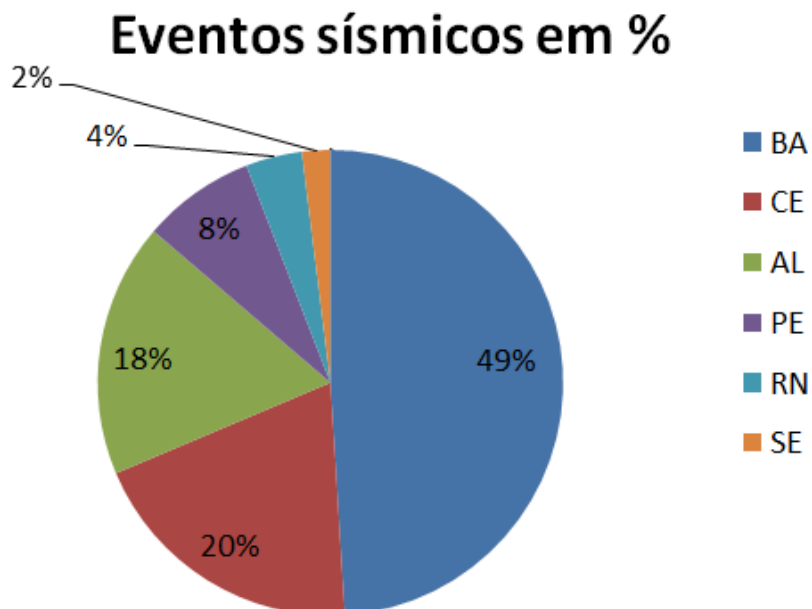
Figura 2: Gráfico de pizza de percentagem de eventos sísmicos de Agosto de 2023 por Estado