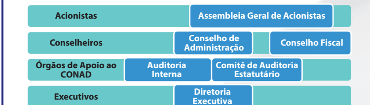
Figura 01 - Estrutura de Governança da ALGÁS

A estrutura de governança também contempla dois órgãos de apoio ao Conselho de Administração: a Auditoria Interna e o Comitê de Auditoria Estatutário. Essa estrutura está em consonância com a Lei 13.303/2016 e é regida por normativos próprios da Companhia: estatuto, políticas e regimento interno. A Assembleia de Acionistas e o Conselho de Administração contam ainda com o suporte do Comitê Estatutário de Elegibilidade para a análise de elegibilidade dos membros indicados para a Diretoria Executiva, para o Comitê de Auditoria Estatutário, para o Conselho de Administração e Conselho Fiscal.