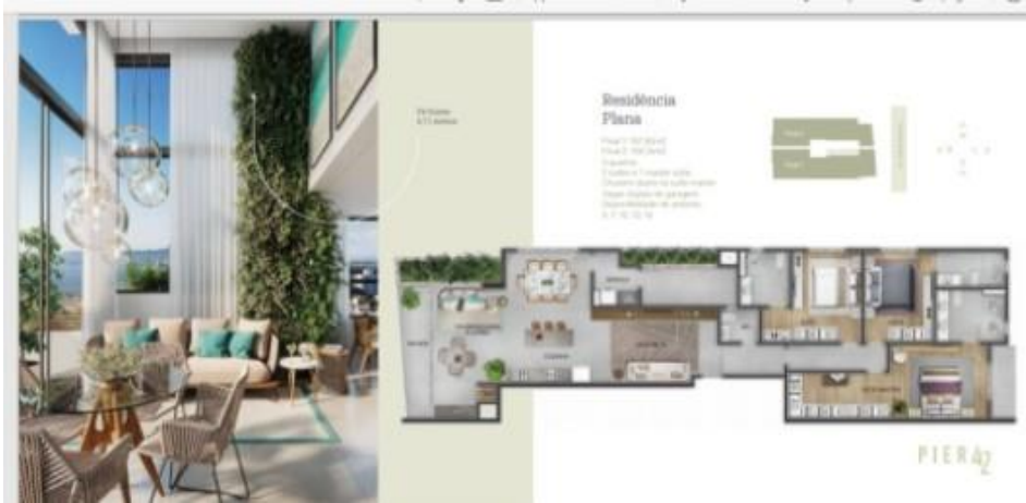
(Chamar atenção para metragem, especificações)

Varanda com portas de correr abrindo para os dois lados , transformando a varanda em terraço . Altura da porta 3,20. Suíte Master 19m 2 , banheiro com duas cubas e preparação para duas duchas de teto. Área técnica com espaço para varal